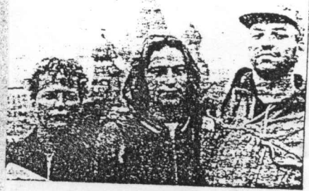
De stad-Groninger band Pear, op de foto op het Rode Plein in Moskou, speelt zaterdag in De Kwinne in Stadskanaal.